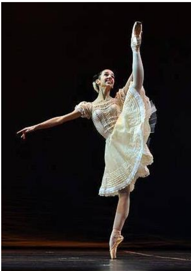
Большая поза Ecartée вперед