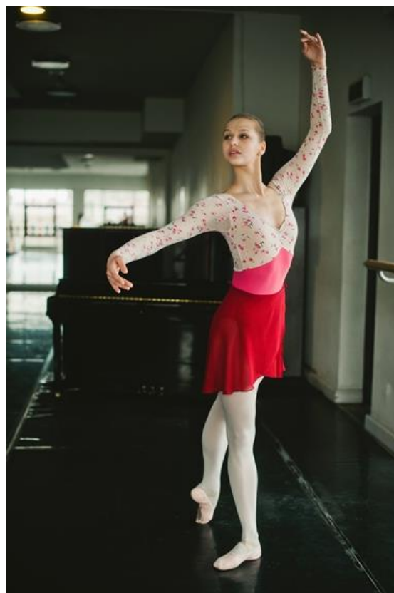
Большая поза Croisee назад