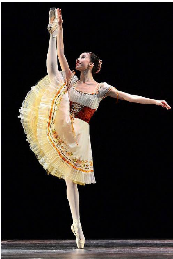
Большая поза Ecartée вперед