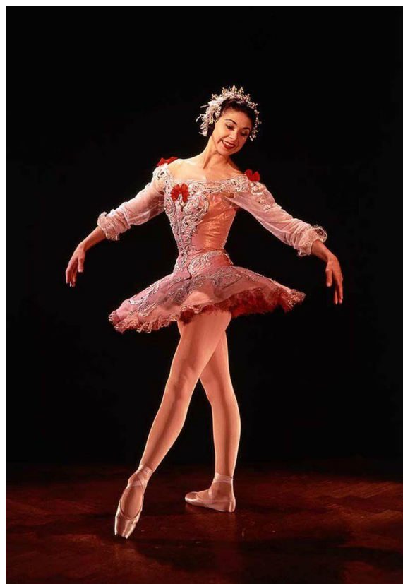
Маленькая поза Croisee вперед