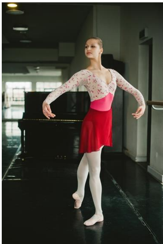
Маленькая поза Croisee назад