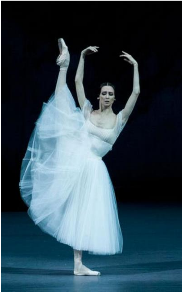
A' la seconde