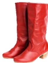
Сапоги народные женские